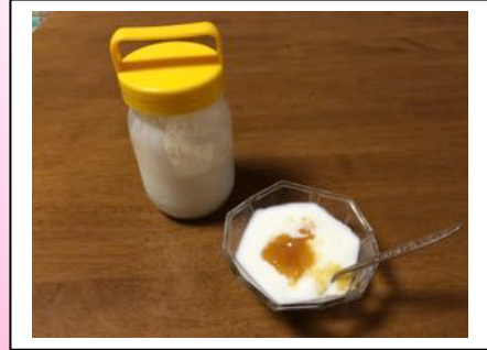
こちらは with ビワシロップです！